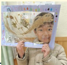
押し花の完成品（展示）