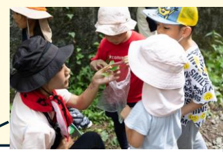
なんの葉っぱか考察している様子