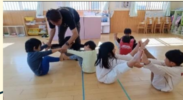
友だち同士協力してバランスをとる様子