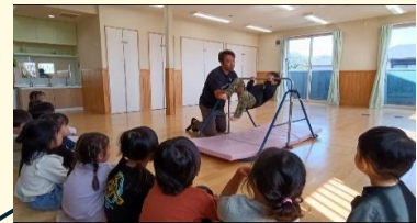
鉄棒の逆上がりをする様子