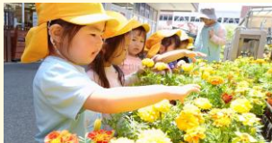
ホームセンターにて花を選んでいる様子