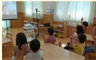
4歳児が英語の歌を歌っている様子