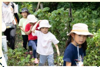
散策路を散策している様子