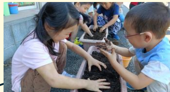
苗植えをするために土に穴をあけている様子