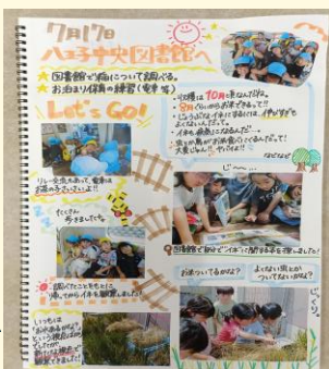
5歳児が図書館で稲について調べている様子