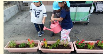
5歳児が花に水やりをする様子