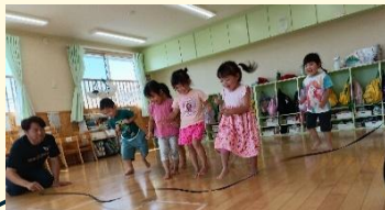
縄跳びの蛇を跳び超える様子

④体操教室の講師から学ぶことにより、子ども達だけでなく、保育者も教え方やポイントを学び、その時間だけでなく、普段の保育に取り入れていくことで子どもたちの意欲を育て、子ども達自身がやりたいと自主的に練習する姿が見られており、体だけでなく心の成長にも繋がっていると感じた。