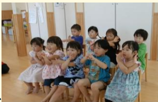
ジェスチャーで講師に伝えている様子