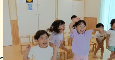
5歳児がリスニングクイズに正解して喜んでいる様子