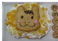
《きらりくんのタルトケーキ》