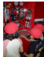
《きりりくんのタルトケーキ》 《消防署見学》